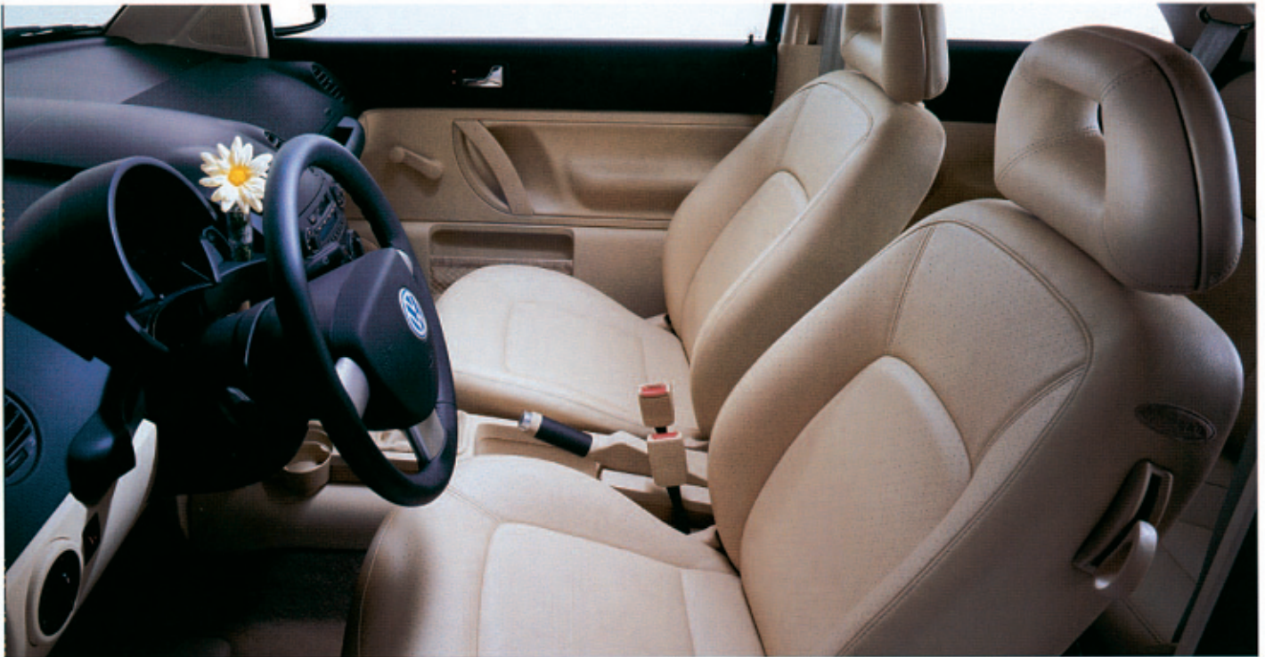
Bilden visar läderklädsel Cream.