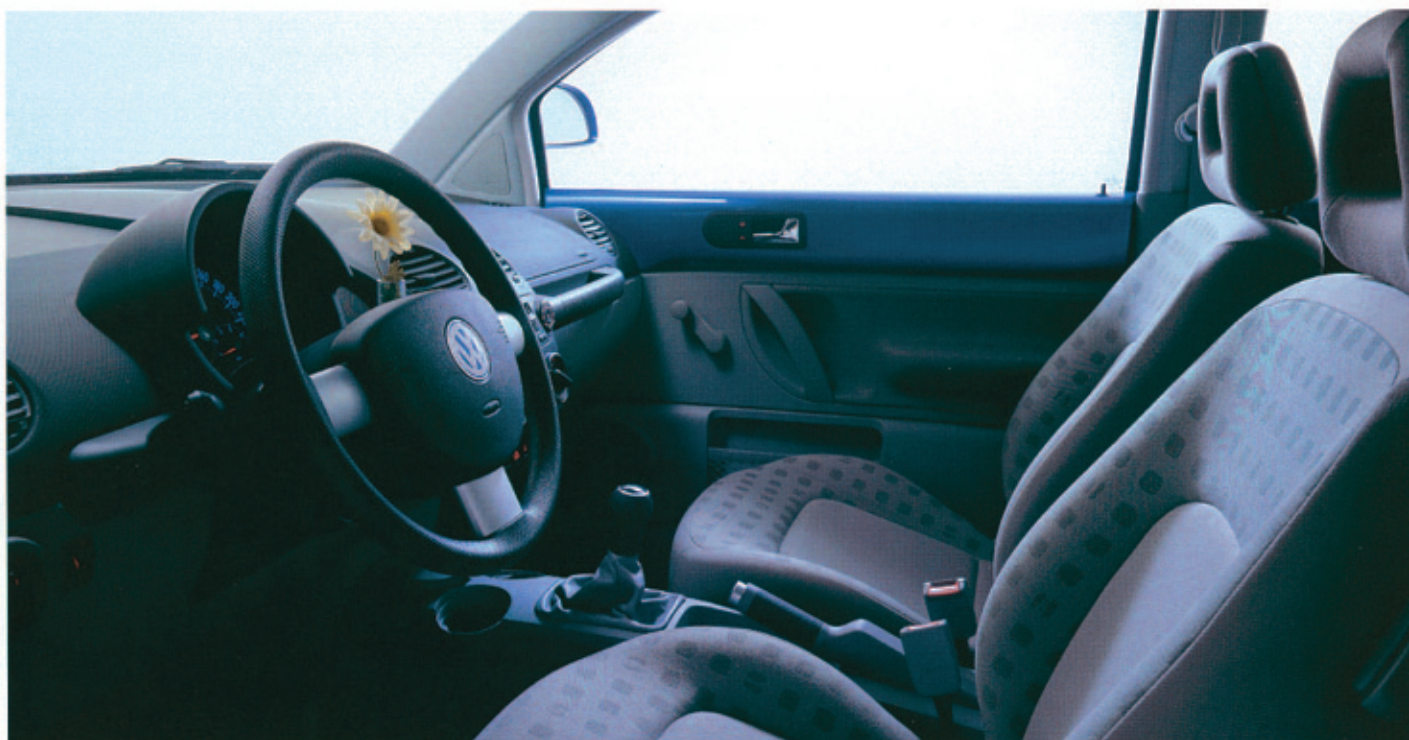
Bilden visar tygklädsel Domino.