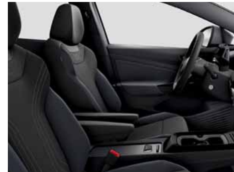
ZK Klädsel Art Velours/Leatherette sidostöd, armstöd och dörrsidor