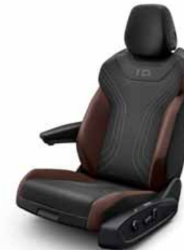
Komfortstol med klädsel Art Velours/ Leatherette på sidostöd, armstöd och dörrsidor