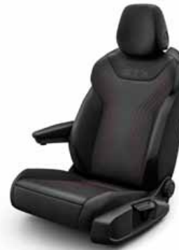
Klädsel textil med röda sömmar/ Leatherette på sidostöd, armstöd och dörrsidor