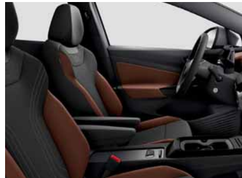
EO Klädsel Art Velours/Leatherette sidostöd, armstöd och dörrsidor