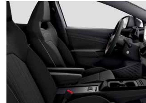
UG Klädsel Alcantara/Leatherette sidostöd, armstöd och dörrsidor (tillval)