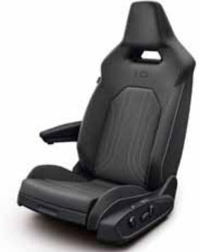
Klädsel textil med röda sömmar/ Leatherette på sidostöd, armstöd och dörrsidor