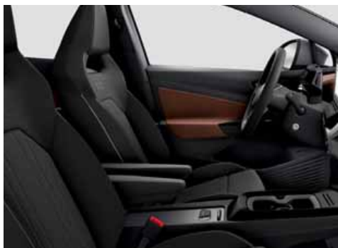
LA Klädsel Art Velours/Leatherette sidostöd, armstöd och dörrsidor