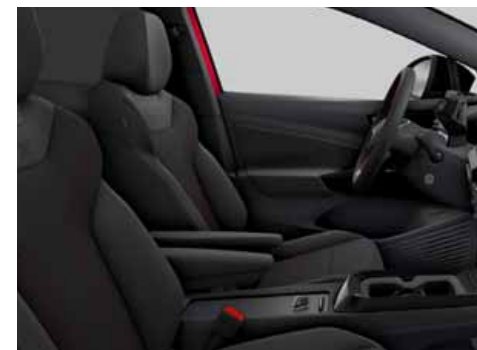
UG Klädsel Art Velours/Leatherette sidostöd, armstöd och dörrsidor