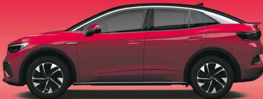
Kings Red | T Metallicklack