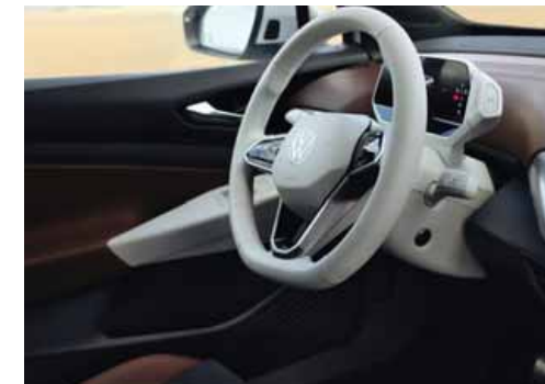
Med Stylepaket och Stylepaket Plus kan man välja vit ratt och vit infotainmentenhet. Ej till GTX.

S Standard T Mot tilläggs kostnad - Ej tillgänglig