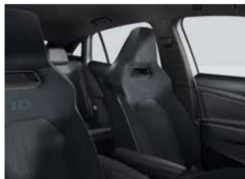
QT Klädsel Art Velours/Leatherette sidostöd, armstöd och dörrsidor