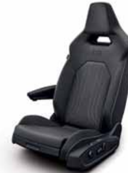
Klädsel textil med röda sömmar/ Leatherette på sidostöd, armstöd och dörrsidor