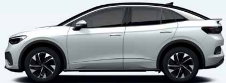
Glacier White | T Metallicklack