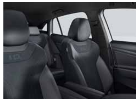
ZK Klädsel Art Velours/Leatherette sidostöd, armstöd och dörrsidor