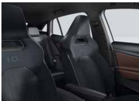
LA Klädsel Art Velours/Leatherette sidostöd, armstöd och dörrsidor