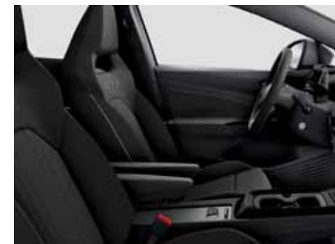
UG Klädsel Alcantara/Leatherette sidostöd, armstöd och dörrsidor (tillval)