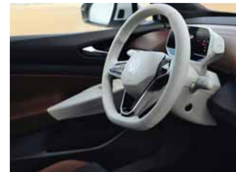
Med Stylepaket och Stylepaket Plus kan man välja vit ratt och vit infotainmentenhet. Ej till GTX.

S Standard T Mot tilläggskostnad - Ej tillgänglig