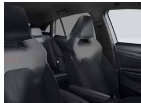
UG Klädsel Art Velours/Leatherette sidostöd, armstöd och dörrsidor