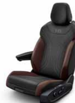
Komfortstol med klädsel Art Velours/ Leatherette på sidostöd, armstöd och dörrsidor