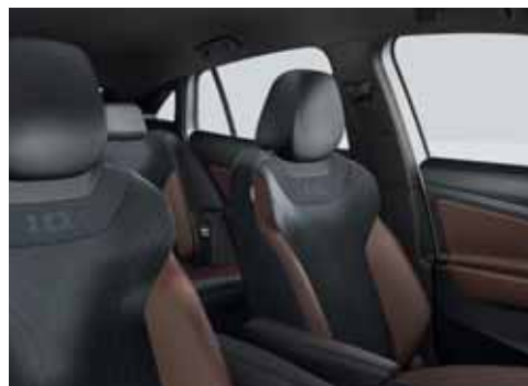
EO Klädsel Art Velours/Leatherette sidostöd, armstöd och dörrsidor