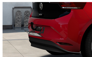
Cykelhållarfäste, avtagbart, monterat bakom registreringskylten bak.