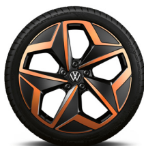
Andoya Penny Copper 19"