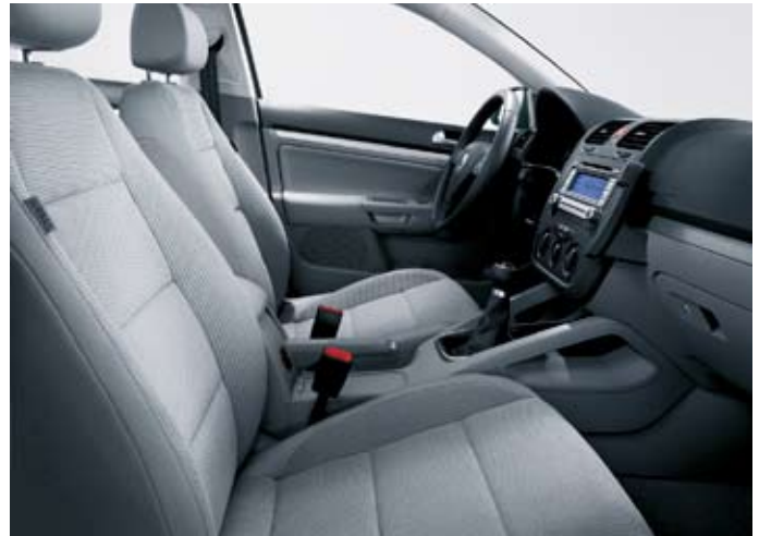
Förarmiljö Jetta Comfortline, med tygklädsel "Maxima".