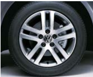
Lättmetallfälg "Atlanta" 16".