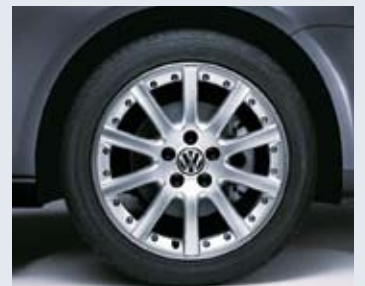
"Grand Prix" 17"