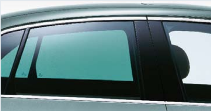
Mörktonade rutor (valfritt tillägg Businesspaket).