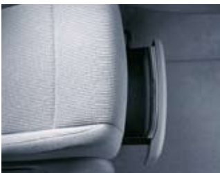
Förvaringslådor under framstolarna.