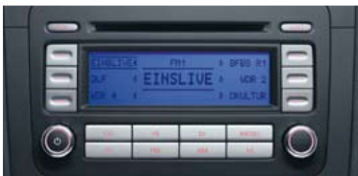
Radio RCD 300 med CD-spelare.