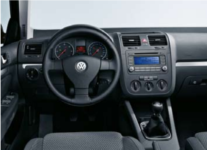
Förarmiljö Jetta Sportline, med tygklädsel "Brick".

Standard 2,0 T FSI. Tillval till TSI 140 och TDI 140.