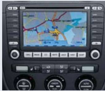
Navigationssystem med multifunktionsdisplay. 2-zons klimatanläggning.