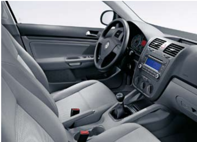
Förarmiljö Jetta Trendline, med tygklädsel "Glow".