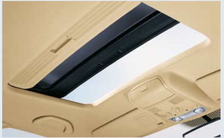
Elsollucka i glas.