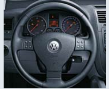
Läderratt, 3-ekrad, med multifunktion.