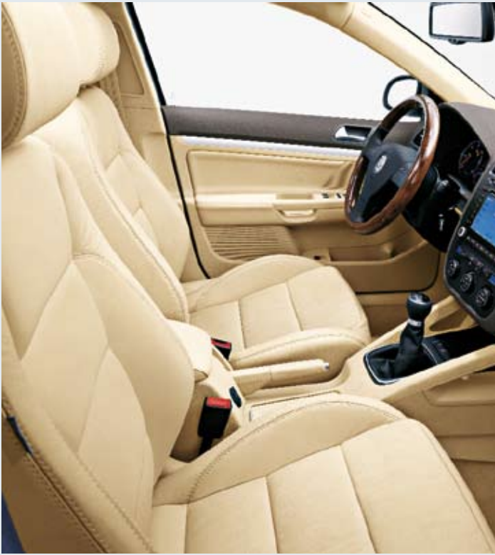
Läderklädsel till Comfortline/Sportline.